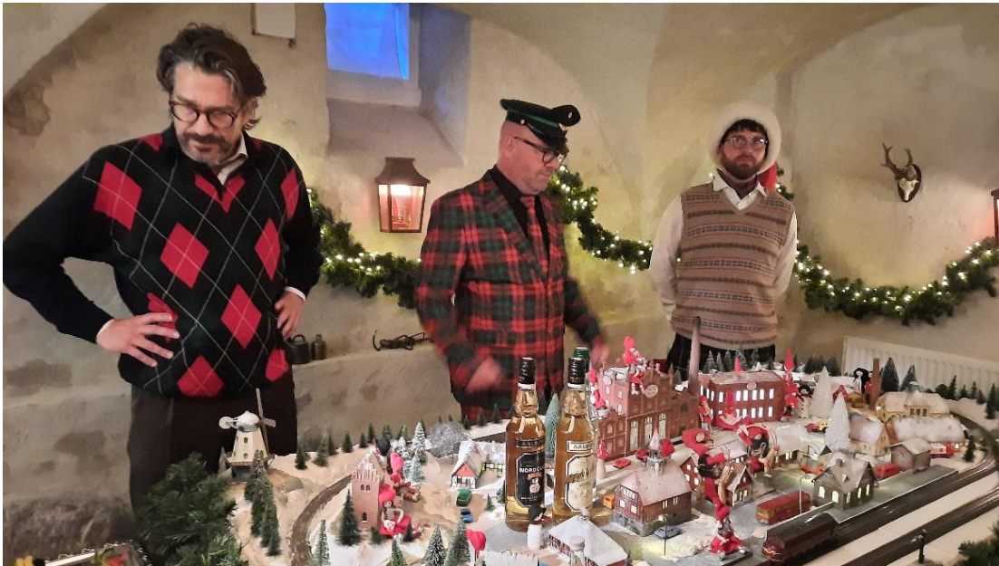
Anlægget studeres og hvem skal have togførerkasketten på.