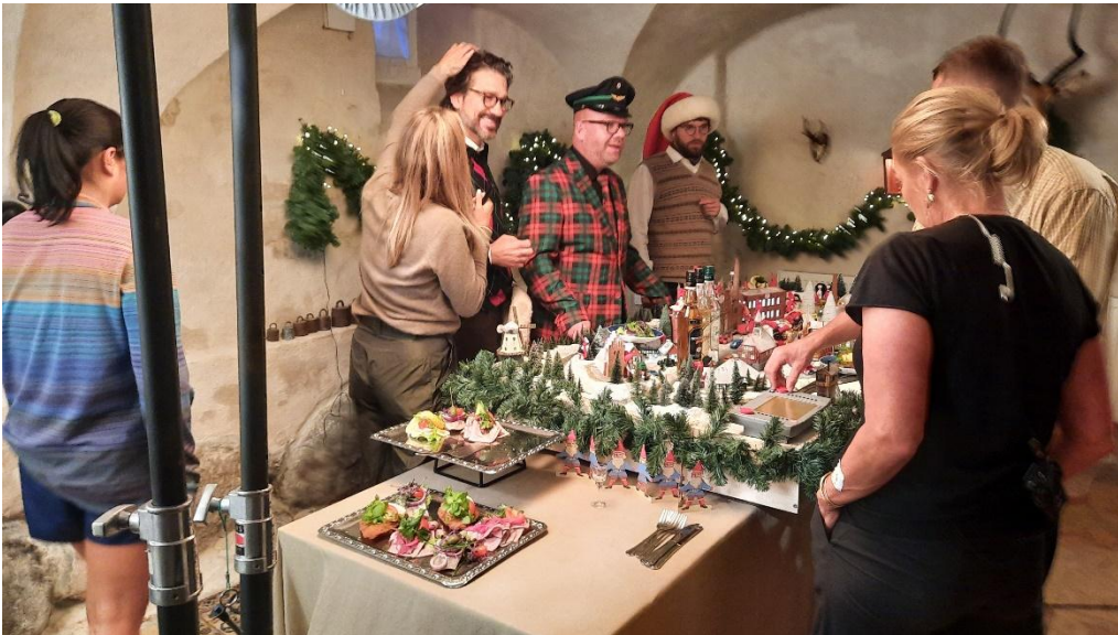
Der skal sættes hår og pudres, før optagelsen tages om. Smørrebrødet er del af indslaget med Aalborg Logen.