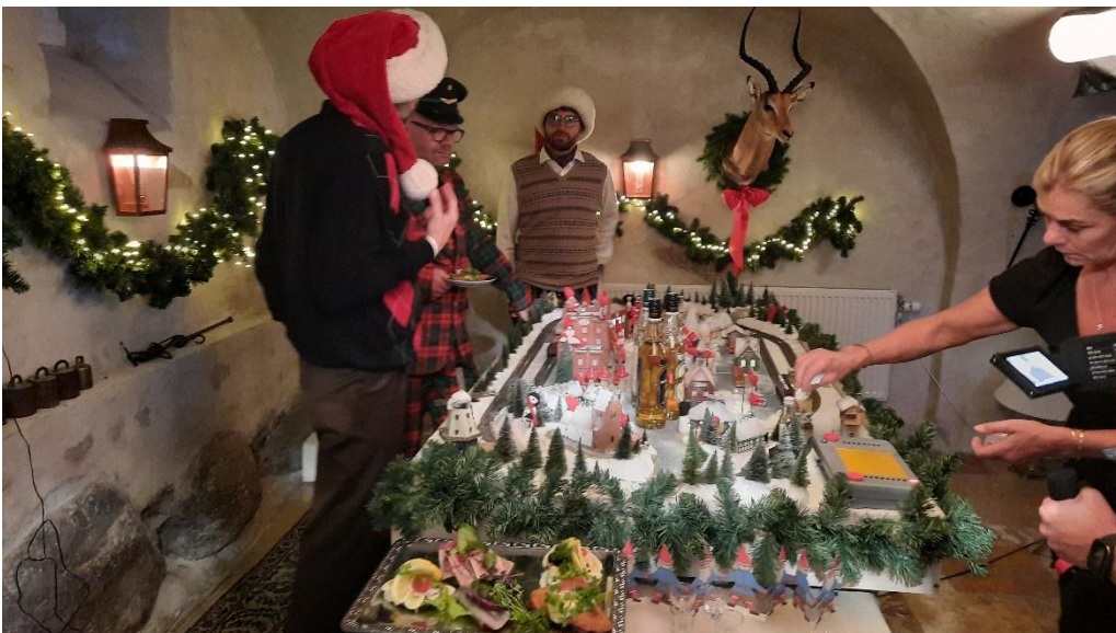
Uha, der røg et par snapseglass med stor fod af i kurven, og der må tørres op og hældes op igen.