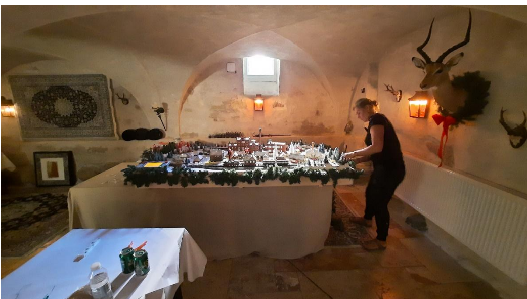
Cille fra filmskabet i gang med at montere grangulande om anlægget og små nisser.