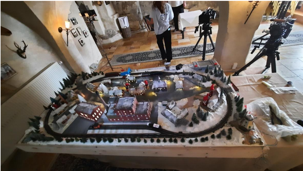
Så er der opstillet og plantet en masse græntræer. Nu skal der drysses sne ud over anlægget.