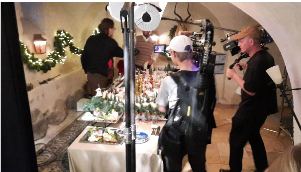
Sådan. Kamera 1 og 2 er klar samt lydmand i baggrunden. Klar til optagelse. Stille.