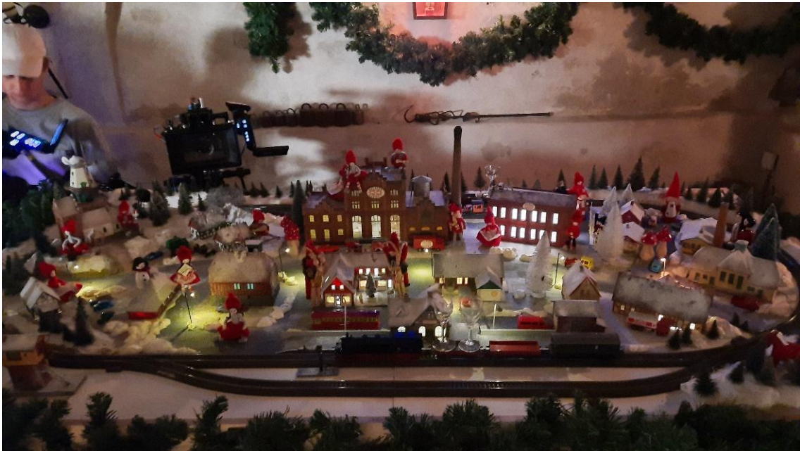
Så er der lys, julenisser og guirlander over anlægget.