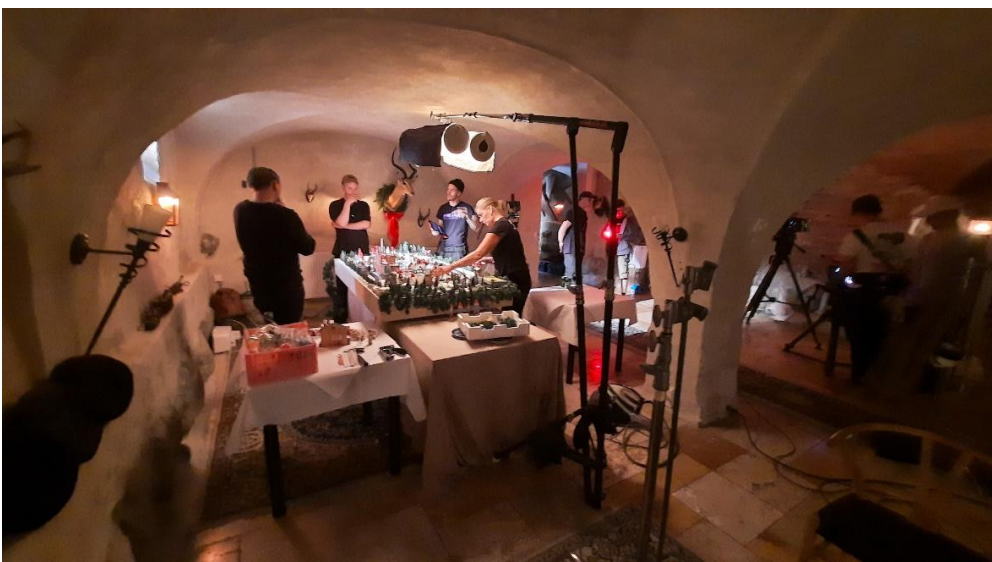
Der opstilles og prøvekøres med et mindre glas. Bare den store projektør over anlægget ikke falder ned over anlægget, så er det hele en ommer. Men der må skæres lidt mere af skråningerne i kurverne.