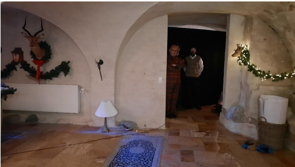
Så er der klar til optagelse. Kom bare frit frem til prøveoptagelse !