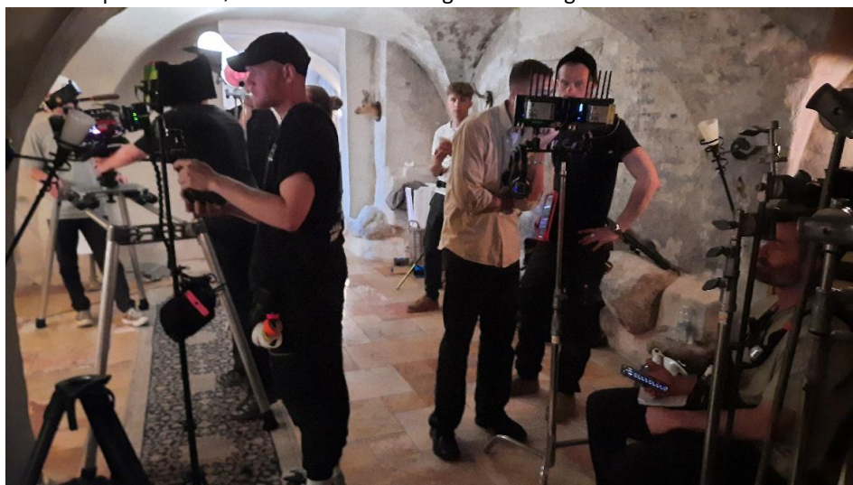
Slut på dagen, og nu skal der pakkes ned i en hulens fart, fordi lokalet om kort skal bruges til andre aktiviteter. Se resultatet af optagelserne af "Aalborg logen" på: https://youtu.be/GqpYiEEluKE .