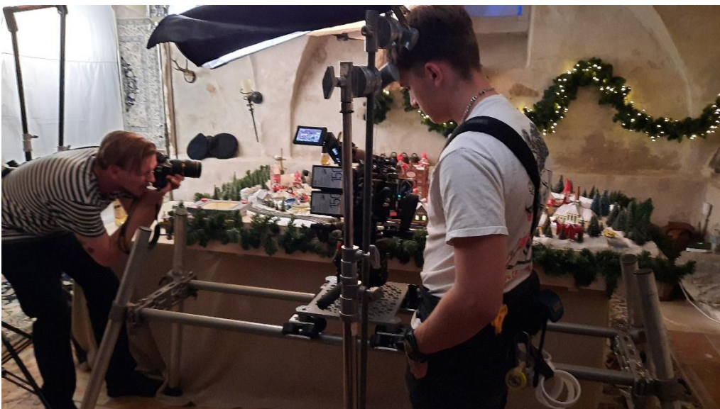
Så er optagelserne i hus, og nu skal der tages fotos og køres med tog, mens kameraet følger med toget på langsiden. Kameraet på stativet kører med samme hastighed som toget. Smart.