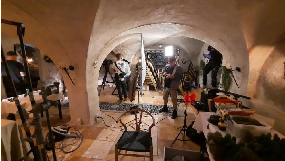
Så kom filmfolkene med alt deres udstyr, projektører og ledninger. Men solen skinner ind ad vinduet.