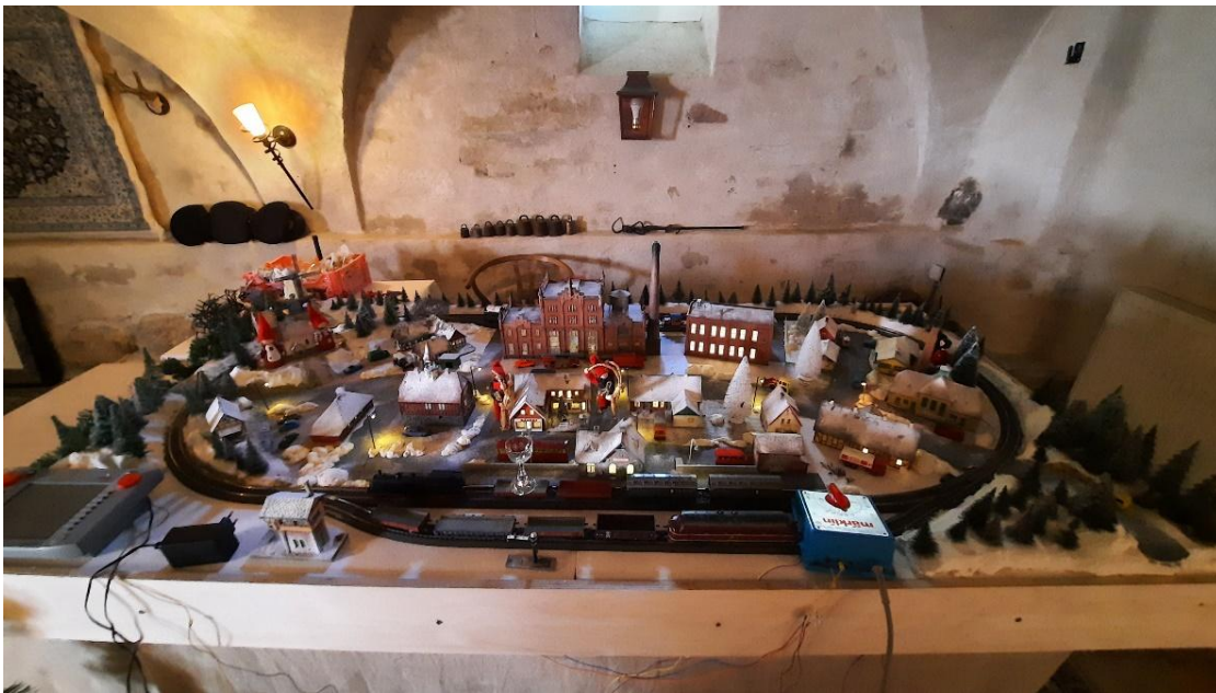
Anlægget er næsten klar, men uha, Trærammen må ikke kunne ses, og der mangler nisser.