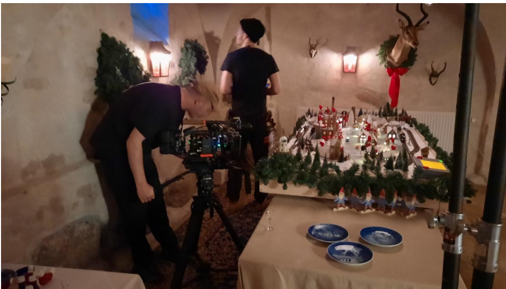
Der indstilles og fokuseres med kameraerne samtidig med, at der hæftes blåt plastik på vinduet, så det virker som vinter udenfor.